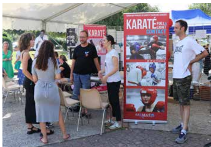
9 SEPTEMBRE : La Journée des associations s'est déroulée sous les meilleurs auspices à l'espace JKM, l'occasion de nouer des contacts privilégiés avec les associations locales.