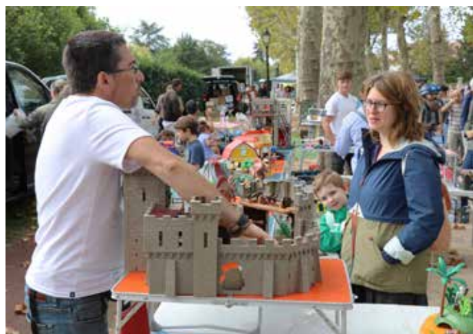
17 SEPTEMBRE : La brocante de Saint-Nom-la-Bretèche a réuni 150 exposants, particuliers et professionnels, de l'avenue des Platanes à la route de Saint-Germain, avec des animations musicales !