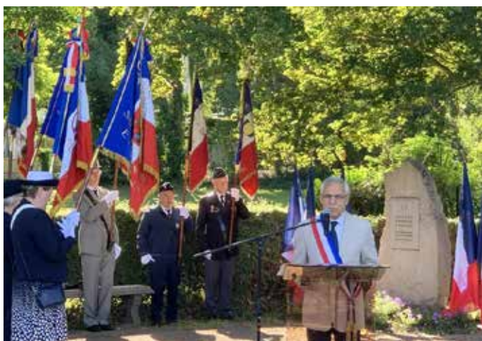
3 SEPTEMBRE : Le 20 août 1944, trois ouvriers agricoles étaient exécutés par les nazis à proximité de la ferme de la Tuilerie-Bignon. Chaque année, les instances officielles leur rendent hommage.