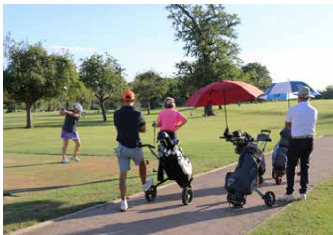
15 SEPTEMBRE : La 35 e Coupe de Golf de la Mairie trophée Patrice Galitzine, ouverte aux Nonnais-Bretéchois, s'est déroulée au golf de Saint-Nom-la-Bretèche sous un soleil radieux. (Résultats page 6)