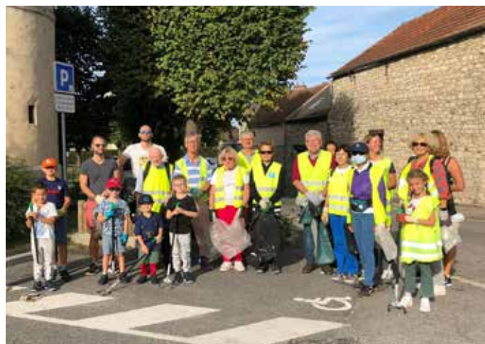
16 SEPTEMBRE : Un nettoyage citoyen a été organisé par un habitant de la commune dans le cadre de l'opération internationale du World Cleanup Day , une initiative soutenue par la mairie.