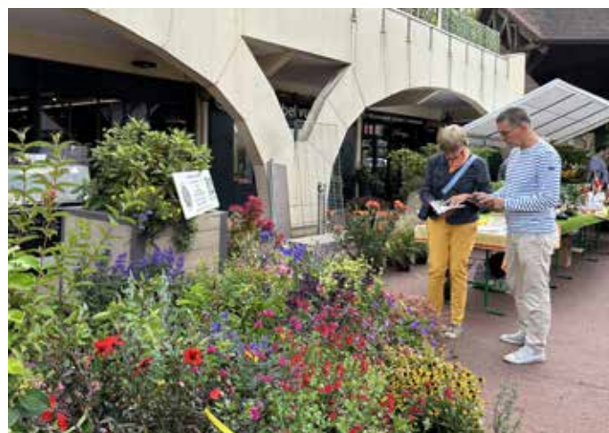
30 SEPTEMBRE : Organisée par l'association Saint-Nom La Nature , la fête de l'environnement s'est déroulée sur la place du village avec de nombreuses plantes, des produits locaux et même des animaux !