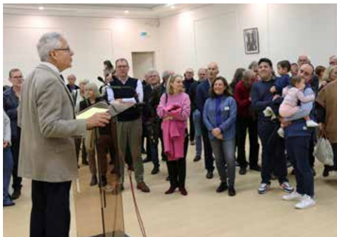
24 NOVEMBRE : Réception en mairie des nouveaux habitants de la commune. Un moment convivial qui leur permet de rencontrer élus, personnel communal et responsables d'associations.