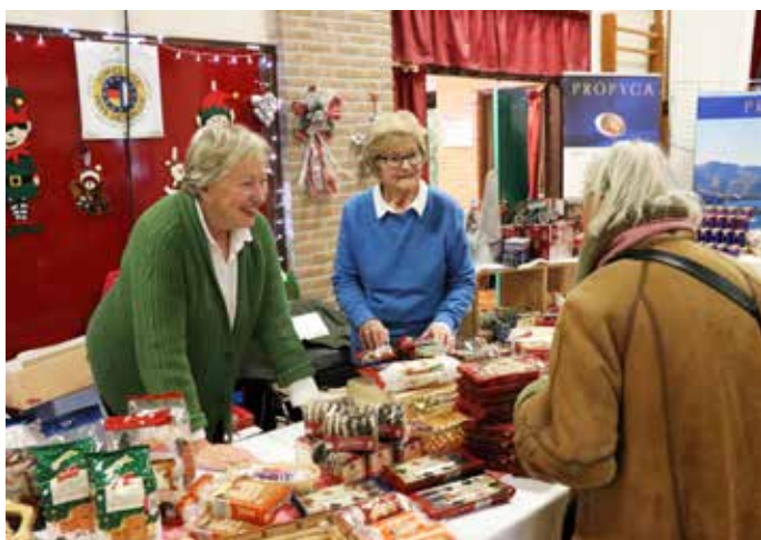
9 DÉCEMBRE : Sourires et ambiance festive étaient au rendez-vous du marché de Noël qui réunissait à l'Espace JKM, professionnels et bénévoles d'associations locales.