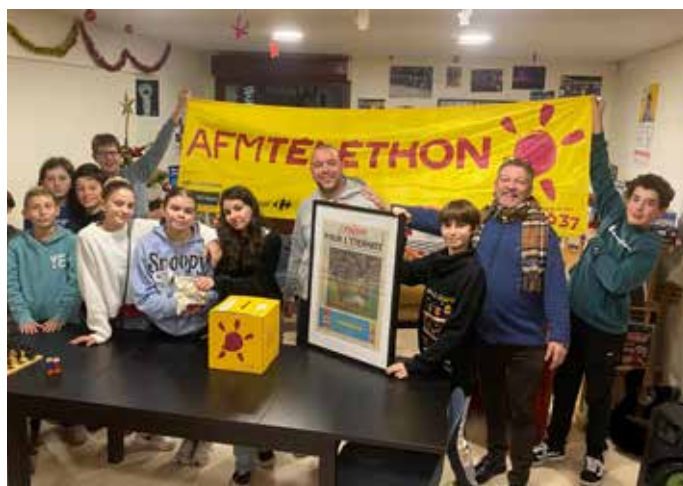
9 ET 10 DÉCEMBRE : La « Téléthon-bola » portée par l'Espace Jeunes était l'une des initiatives programmées en faveur du Téléthon cette année. Elle a permis de collecter à elle seule la jolie somme de 795 €.