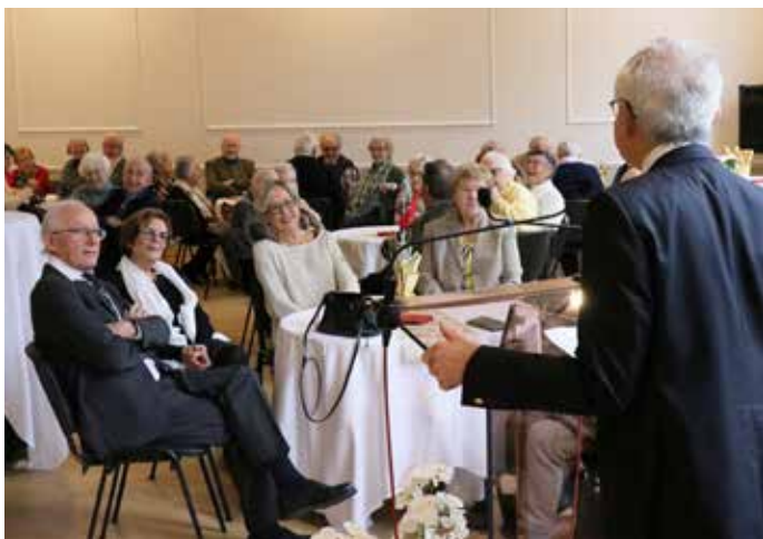
18 DÉCEMBRE : Plus d'une centaine de séniors ont répondu à l'invitation du Centre Communal d'Action Sociale pour partager ensemble un agréable repas, salle du Conseil municipal de la mairie.