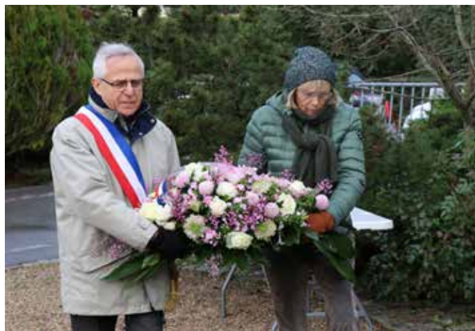
5 DÉCEMBRE : Fleurissement du monument aux morts en hommage aux soldats tombés pour la France en Algérie, Maroc et Tunisie après l'allocation de Monsieur le Maire en public.