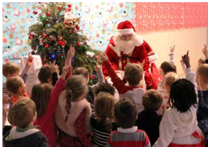
22 DÉCEMBRE : Animations proposées aux enfants de l'école maternelle et sur la place du village en présence du père Noël et de ses lutins, avec de la magie, un goûter et une ambiance musicale festive.