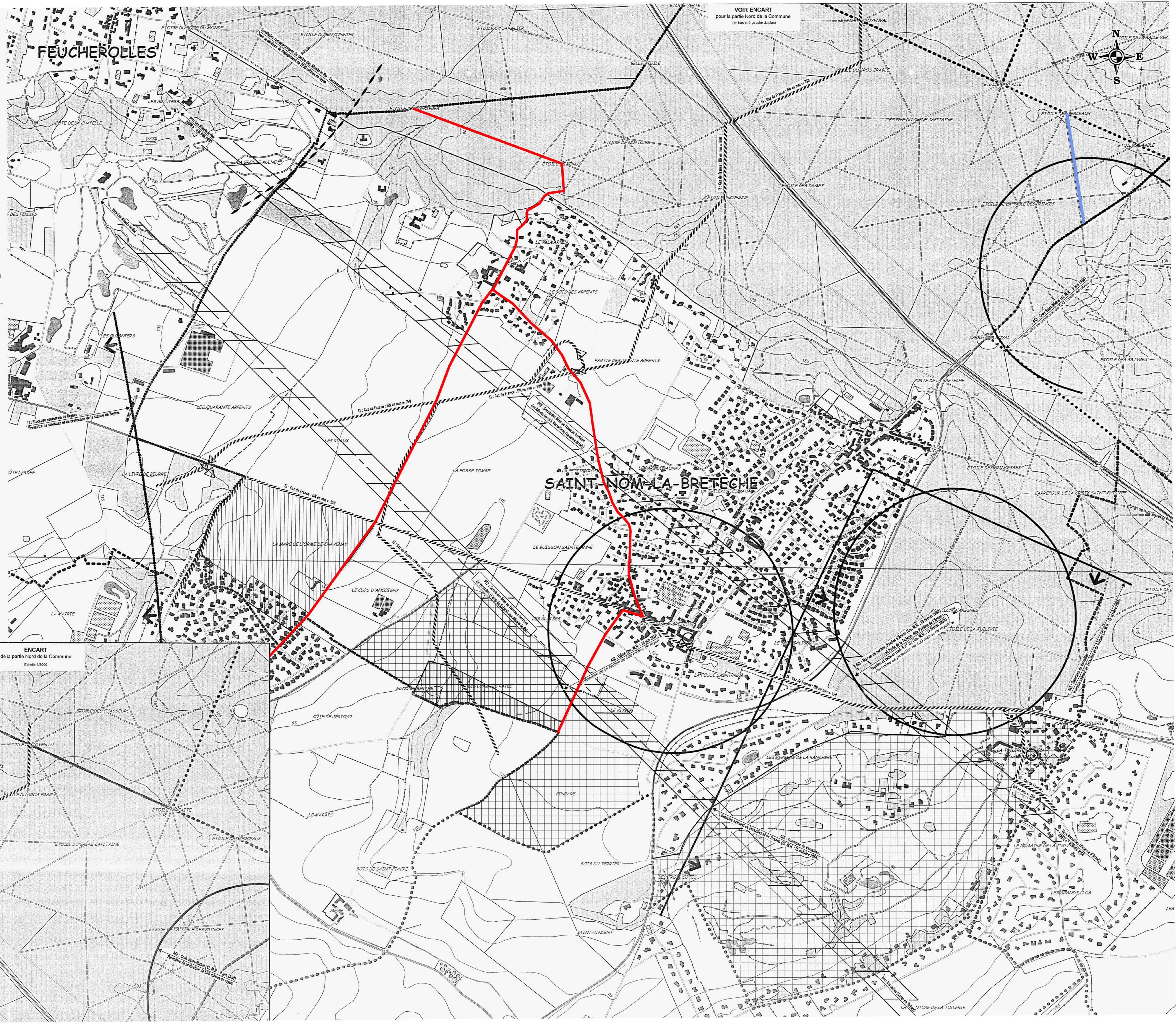
ENCART de la partie Nord de la Commune Echelle 1:5000