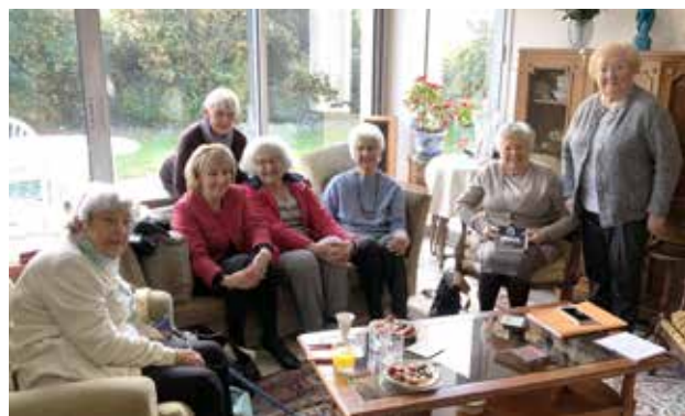
Réunion mensuelle du groupe de lecture

Notre voyage de printemps nous conduira en Italie pour une semaine du 14 au 21 mai.